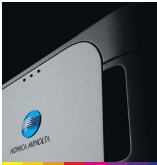
Impressora laser em cores